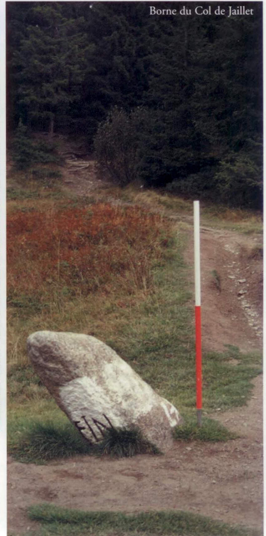
Borne du Col de Jaillet

Ce fait révèle qu’à des époques plus récentes, la frontière fut de nouveau l’objet de contestations et de querelles à propos de la mobilité des troupeaux et de la propriété des alpages notamment (ceux situés au sud du col de Niard, au lieu-dit Petetry (commune actuelle de Cordon). Contrairement à ce que l’on pourrait croire en raison de la situation des deux communes par rapport à cet alpage, c’est Cordon qui a finalement eu gain de cause. On peut penser que son attachement à cet alpage devait être fort ancienne. Il semble donc préférable de laisser l’alpage de Petetry aux Allobroges.