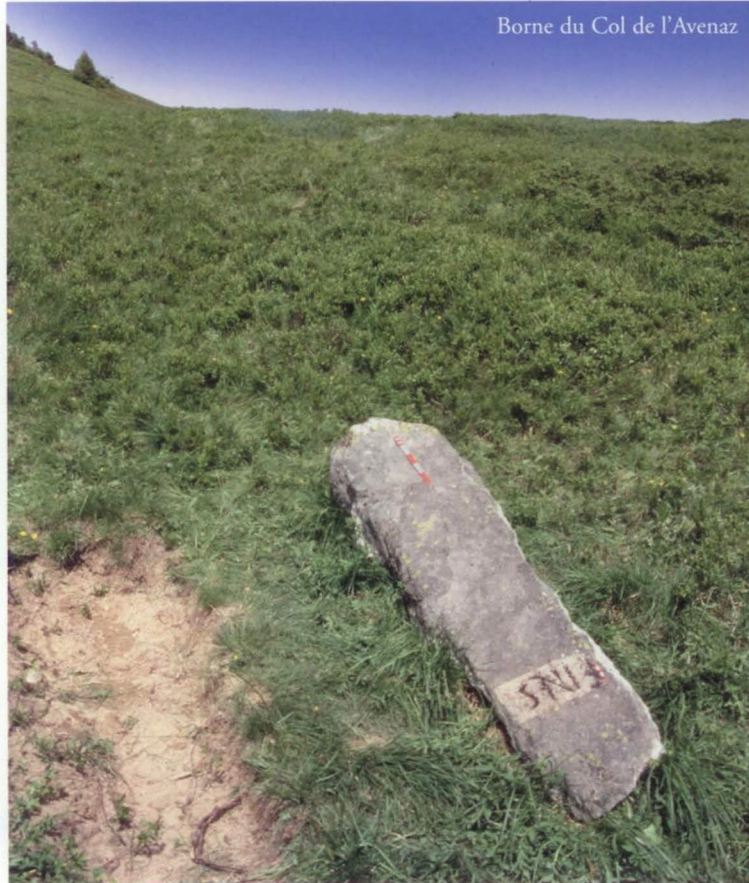
Borne du Col de l'Avenaz