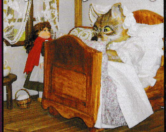
Le petit chaperon rouge